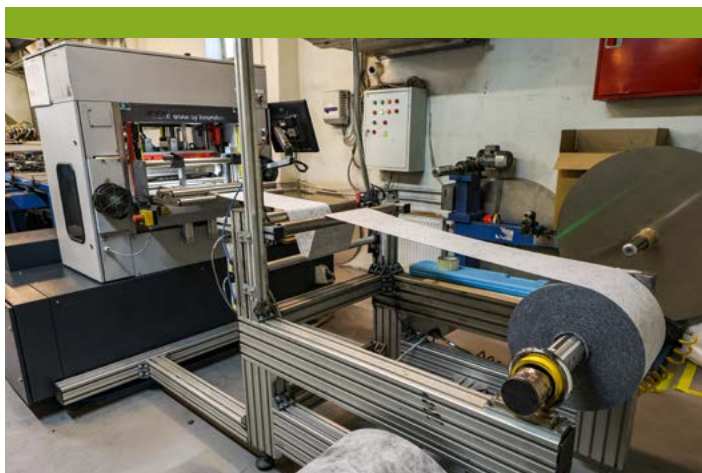
Гофрирующая машина формирует из плоского материала штору. Ее шаг и высота регулируются машиной. На выходе получается полуфабрикат с приклеенными боковыми планками. Количество гофр подсчитывается специальным лазерным датчиком, который дает команду автоматическому ножу. Последний отрезает фильтр под нужный размер. Далее на боковину наносится маркировка

Линия для производства панельных фильтров Masrol (Италия) изготавливает полиуретановые отливки и формирует готовые воздушные фильтры с корпусами из полиуретана. Оборудование позволяет выпускать несколько моделей воздушных фильтров одновременно