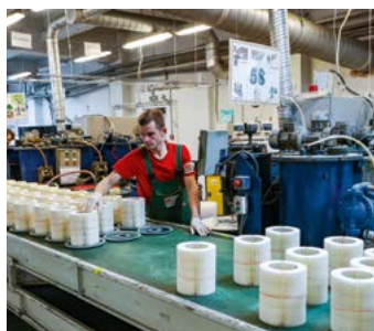
Изготовление круглых фильтров

Сегодня «БИГ Фильтр» выпускает от 1 до 1,5 млн фильтров в месяц — больше, чем все остальные российские фильтровальные компании, вместе взятые. По словам Е. Пирогова, компания могла бы продавать существенно больше продукции, чем сейчас, однако производство не справляется с объемами заказов. Кроме того, в «БИГ Фильтр» оказались не готовы к кратному росту спроса, который произошел в конце зимы — начале весны. Сложность и в том, что большая часть сырья и материалов по-