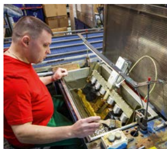
Здесь топливные фильтры проверяются на герметичность

снабжать производство привычными материалами. К тому же их ввоз осуществляется через третьи страны, что существенно увеличивает логистическое плечо. Компания, по его словам, хотела бы использовать российское сырье, но полноценной замены западным поставщикам (например, в сфере фильтровальной бумаги) в РФ на сегодняшний день нет.